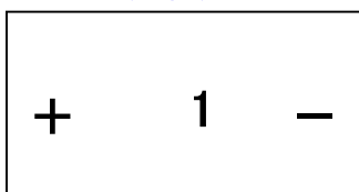
(センターターミナル)